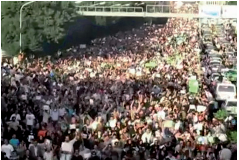
Standbild aus einem Handyfilm aus Teheran (YouTube 17.6.2009)

Wir Iraner auf der ganzen Welt, egal ob in Deutschland, in Amerika oder in Australien, wir sind in Gedanken bei ihnen und wir wissen, dass sie es schaffen werden, etwas zu verändern!